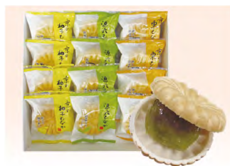
品番 485 京都たちばなや