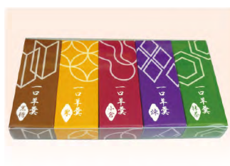
品番 491 京都たちばなや