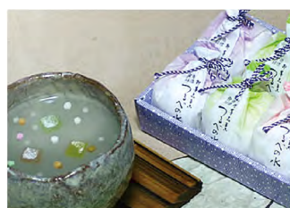
品番 484 京都たちばなや