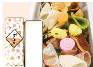
品番 483 京都たちばなや