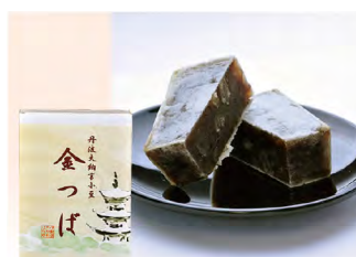
品番 478 京都たちばなや