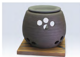
品番 500-38 &lt;茶香炉&gt;