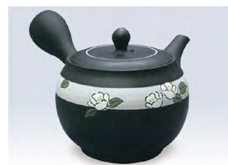
品番 500-34 &lt;帯アミ&gt;