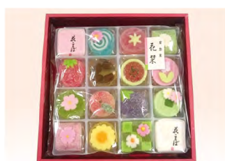
品番 496 上尾製菓