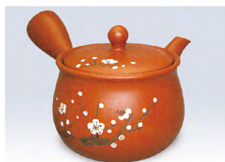
品番 500-24 &lt;さわやか茶こし&gt;