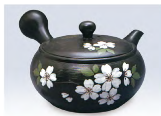
品番 500-33 &lt;帯アミ&gt;