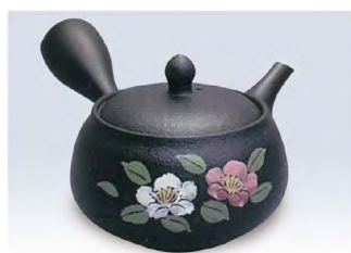
品番 500-35 &lt;帯アミ&gt;