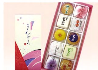
品番 493 京都たちばなや