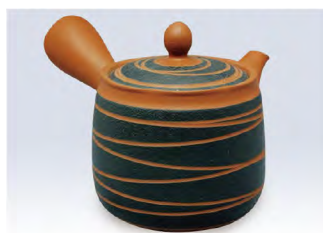
品番 500-32 &lt;帯アミ&gt;