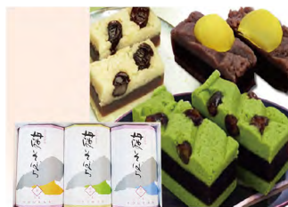
品番 461 京都たちばなや