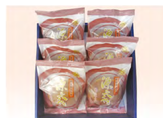
品番 476 京都たちばなや